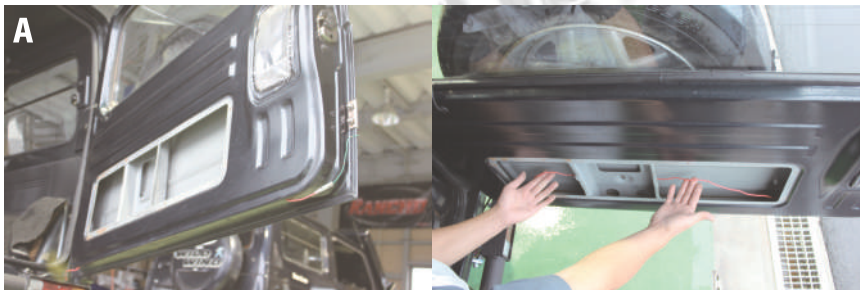
A. ナンバー灯のプラス配線に延長配線を繋ぎリアゲート左下の水抜き穴から配線を入れます。