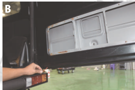
B. リアゲート右下の水抜き穴から配線を出します。